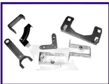
Tranciati in lamiera