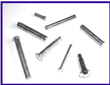
Perni e rivetti