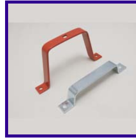
Maniglie per vetrine