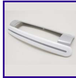
Maniglia porta frigo