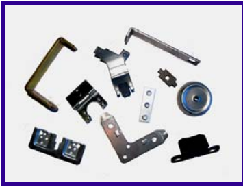
Componenti per elettrodomestici