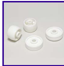
Rotelle e piedini in nylon