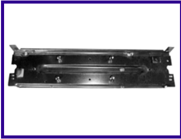
Traversa porta compressore frigorifero