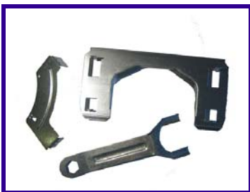
Tranciati in lamiera