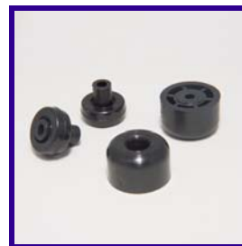
Rotelle e piedini in nylon