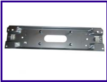
Traversa porta compressore frigorifero